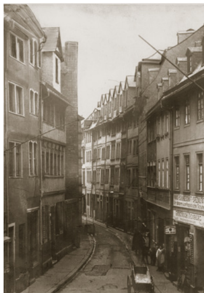
Judenviertel Hintere Synagogengasse

Durch das Anwachsen der Gemeinde und die Bauweise der Häuser herrschte eine extreme Enge. Die Grundstücke im Judenviertel waren durch die räumlichen Beschränkungen ineinander verschachtelt, schmal und tief.