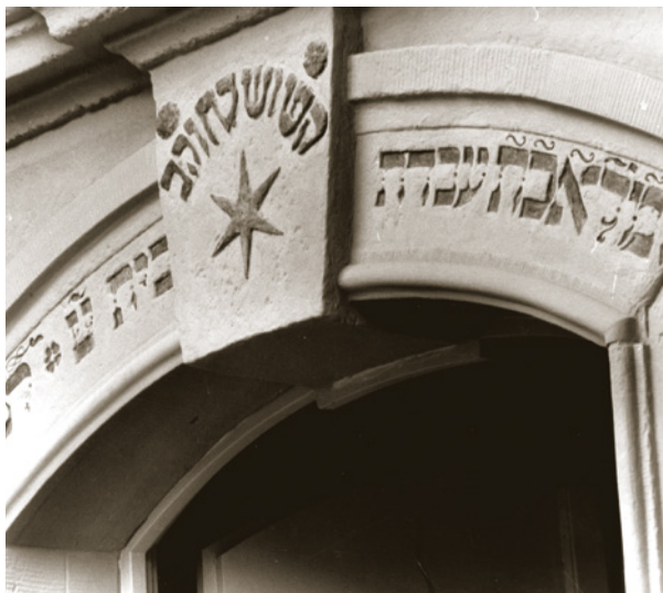
Eingangportal der Synagoge Weisenau

Bei der Belagerung von Mainz 1793 wurde die Synagoge schwer beschädigt. Erst 25 Jahre später waren die Schäden behoben. In der Pogromnacht 1938 plünderten und entweihten die Nationalsozialisten die Synagoge. Da ein Übergreifen der Flammen auf die benachbarten Häuser befürchtet wurde, setzten sie das Gebäude jedoch nicht in Brand. 1940 wurden die Synagoge und das Grundstück zwangsverkauft und in der Nachkriegszeit als Schuppen und Hühnerstall zweckentfremdet.