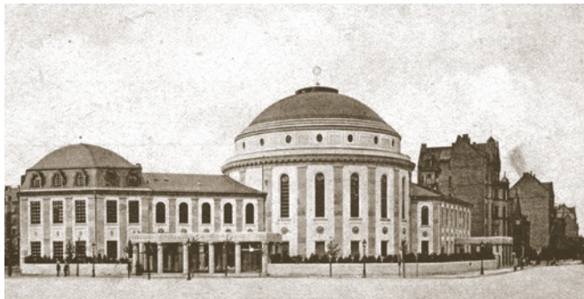
Hauptsynagoge, zerstört 1938

Die 1912 nach dem Entwurf des Stuttgarter Architekten Willy Graf errichtete Hauptsynagoge an der Kreuzung von Hindenburg- und Josefsstraße wurde in der Pogromnacht vom 9. auf den 10. November 1938 geplündert und in Brand gesetzt. Mittelpunkt der Anlage war ein monumentaler Rundbau mit großer Kuppel, in dem sich der eigentliche Betsaal befand. Vom Rundbau aus erstreckten sich zwei niedrigere Seitenflügel, in denen Wochentagssynagoge, Gemeinderäume, Trausaal und das Museum Jüdischer Altertümer Platz fanden. Den Seitenflügeln war je ein Säulenportikus vorgelagert. Nach dem Krieg baute man auf dem Gelände das Zollamt. Bei Bauarbeiten wurden 1988 Reste des Säulenportikus gefunden und wieder aufgerichtet. 98 Jahre nach der Einweihung der Hauptsynagoge in Mainz am 3. September 1912 und rund 70 Jahre nach ihrer Zerstörung durch die Nationalsozialisten erhielt die rheinland-pfälzische Landeshauptstadt wieder ein sichtbares Zeichen für ein neues lebendiges Judentum. Das nach den Plänen des Kölner Architekten Manuel Herz erbaute neue Gemeindezentrum wurde 2010 am gleichen Standort eingeweiht. „Keduschah“ ist das hebräische Wort eines Segensspruchs für „Heiligung“, dessen fünf Buchstaben der neuen Synagoge in Mainz ihre Form geben und sie gliedern. Die Architektur mit ihrer eigenständigen Formsprache und den von grün glasierten Keramikprofi-