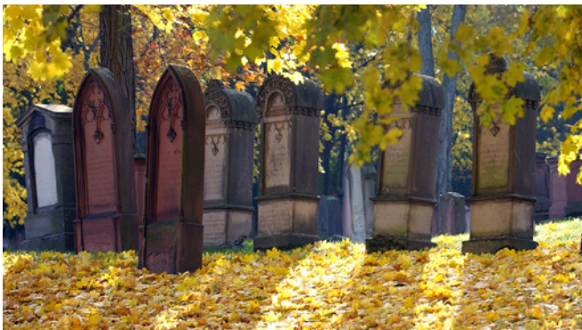
Alter Jüdischer Friedhof „Judensand“

Im Jahr 1438 wies der Rat der Stadt die Mainzer Juden auf Veranlassung der Zünfte aus, der Friedhof wurde abgetragen und umgepflügt. Die mittelalterlichen Grabsteine wurden verschleppt und in den folgenden Jahrhunderten als Baumaterial verwendet. Ein Teil des Friedhofsgeländes wurde damals von der Stadt zur Benutzung als Weinberg verpachtet.