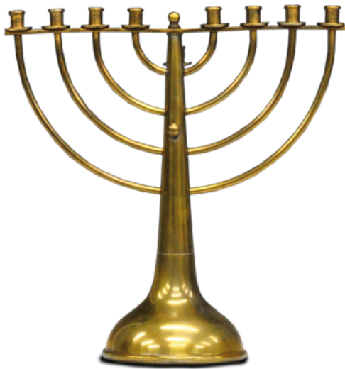
Chanukkia aus der Judaica-Sammlung

Die Dauerausstellung „Magenza – 1000 Jahre jüdisches Mainz“ im Stadthistorischen Museum auf der Zitadelle zeigt die bedeutende und wechselvolle Geschichte der Mainzer Juden seit dem Mittelalter im vollen Umfang: Zeiten hoher geistiger und kultureller Blüte einer traditionsreichen Gemeinde, aber auch Phasen der Verfolgung, Vertreibung und Vernichtung bis hin zum Holocaust im 20. Jahrhundert. Gleichzeitig dokumentieren Tafeln und Filme den Neubeginn und die Aussöhnung nach 1945 und die Entwicklung der Jüdischen Gemeinde Mainz bis 2000.