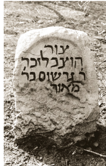
Gedenkstein Gerschom ben Jehudah

Seit etwa 1700 konnte wieder ein jüdischer Friedhof nachgewiesen werden. Das Gelände dieses Friedhofes schloss sich an den „alten Judensand“ an der Mombacher Straße an. Dieser Friedhof wurde belegt, bis er 1880 durch den Neuen Jüdischen Friedhof an der Unteren Zahlbacher Straße abgelöst wurde. Er umfasst etwa 1.500 Grabsteine.