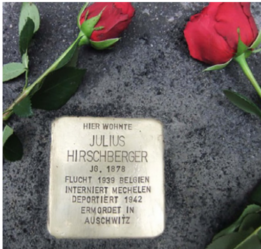
Einer der in Mainz verlegten Stolpersteine

Die Stolpersteine sind dem Gedenken an die Opfer des Nationalsozialismus gewidmet. Kleine quadratische Gedenktafeln aus Messing werden vor dem letzten frei gewählten Wohnort der Opfer in den Boden eingelassen. Jeder Mensch, jedes Schicksal erhält einen eigenen, individuellen Stolperstein. Die Steine sind alle von Hand gefertigt und der Text beginnt meist mit „Hier wohnte...“, gefolgt vom Namen des Opfers, Geburtsjahr sowie dessen Schicksal.