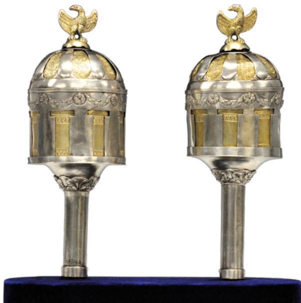
Kether der Torarolle

Die Gräber blieben während des NS-Regimes und der Kriegszeit unversehrt. Bis heute werden Mitglieder der jüdischen Gemeinde hier beigesetzt.