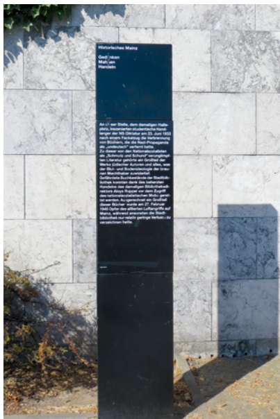
Gedenktafel am Rheinufer