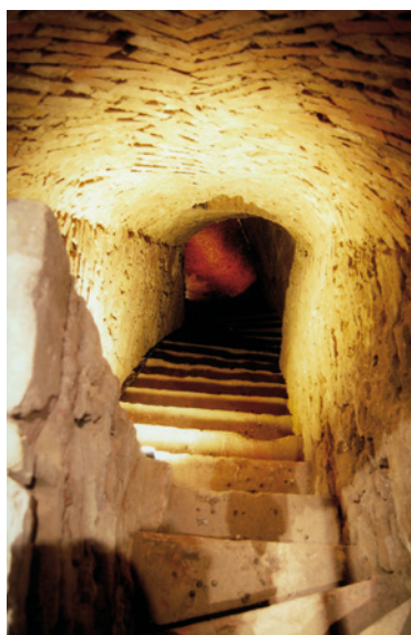
Blick in die Mikve

Die Synagoge geriet in Vergessenheit, erst 1978 wurde die ursprüngliche Bedeutung des Gebäudes durch die Ausstellung „Juden in Mainz“ wiedererkannt. Das Gebäude wurde unter Denkmalschutz gestellt, der Landeshauptstadt Mainz übereignet und mithilfe des 1993 gegründeten Fördervereins restauriert. Am 27. Mai 1996 wurde die Synagoge eingeweiht, genau 900 Jahre nach Gezerot Tatnu, dem Tag des 1096 von Kreuzfahrern verübten Massakers an der damaligen jüdischen Gemeinde von Mainz.