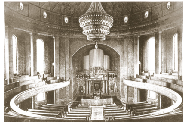
Ehemalige Hauptsynagoge, Betsaal

len bedeckten Fassadenflächen wendet sich bewusst von gewohnten Bauformen und -materialen ab. Die Gestaltung beeindruckt und vermeidet Anpassung und Harmonisierung. Manuel Herz schließt den Bogen vom Mittelalter zur Gegenwart ohne direkte Bezugnahme auf Verfolgungen, Pogrome und den Holocaust. Vielmehr basiert sein architektonisches Werk auf überlieferten Texten der Tora. Durch die auf dem Vorplatz stehenden Fragmente der Säulenhalle des Vorgängerbaus entsteht auch eine Verbindung zwischen der zerstörten Hauptsynagoge von 1912 und der heutigen Synagoge.