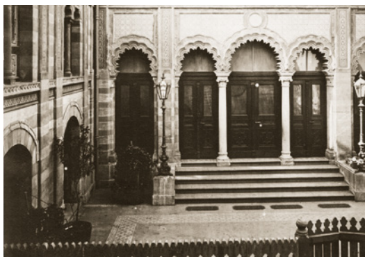
Synagoge von Ignaz Opfermann

Zwischen Klarastraße und der damaligen Rechengasse wurde nach Plänen von Ignaz Opfermann 1846–1853 eine Synagoge in einem Mix aus maurischen und romanischen Stilelementen für die liberale Israelitische Religionsgemeinde erbaut. Sie bot bis zum Bau der neuen Hauptsynagoge 1912 mehr als 760 Menschen Platz. Nach ihrem Verkauf diente sie bis 1937 der Stadtverwaltung als Lagerhalle. 1945 wurde sie bei einem Bombenangriff zerstört. Ein Glasrelief erinnert an dieses Bauwerk.