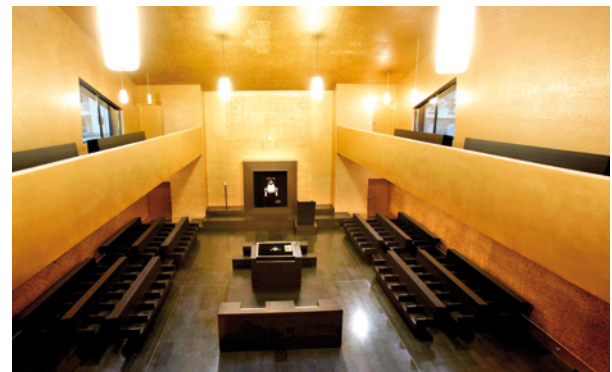
Neue Synagoge, Betsaal

len bedeckten Fassadenflächen wendet sich bewusst von gewohnten Bauformen und -materialen ab. Die Gestaltung beeindruckt und vermeidet Anpassung und Harmonisierung. Manuel Herz schließt den Bogen vom Mittelalter zur Gegenwart ohne direkte Bezugnahme auf Verfolgungen, Pogrome und den Holocaust. Vielmehr basiert sein architektonisches Werk auf überlieferten Texten der Tora. Durch die auf dem Vorplatz stehenden Fragmente der Säulenhalle des Vorgängerbaus entsteht auch eine Verbindung zwischen der zerstörten Hauptsynagoge von 1912 und der heutigen Synagoge.