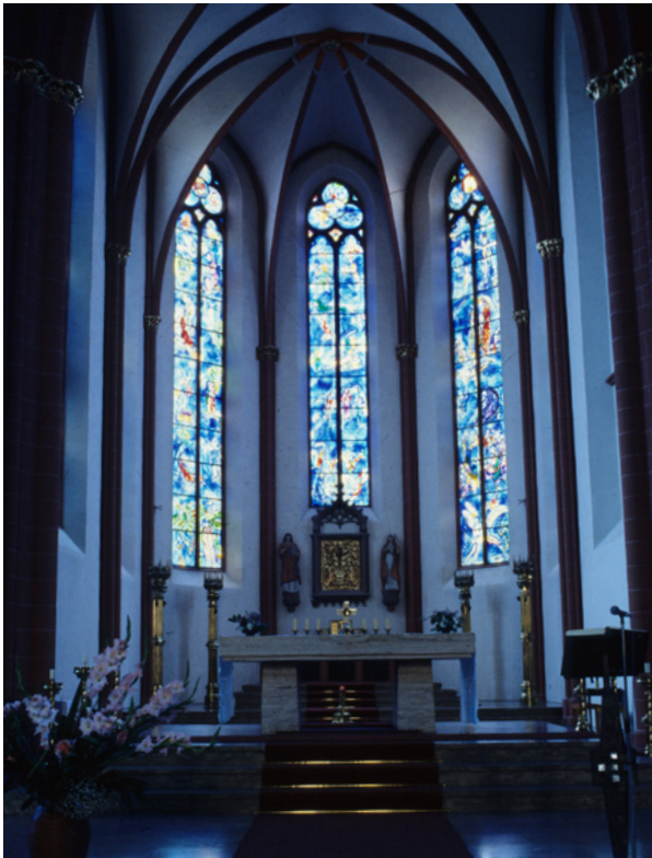
Chagallfenster im Chor der Kirche

Die gotische Kirche St. Stephan ist nicht nur ein kulturhistorisch bedeutender Bau, sondern die einzige Kirche in Deutschland, für die der jüdische Künstler Marc Chagall (1887 – 1985) Fenster schuf. In Russland geboren, verbrachte er die längste Zeit seines Lebens in Frankreich. Blaues Licht fällt durch die Fenster in den Kirchenraum von St. Stephan, und in diesem Licht bewegen sich scheinbar schwerelos nicht nur Engel, sondern auch andere biblische Gestalten.