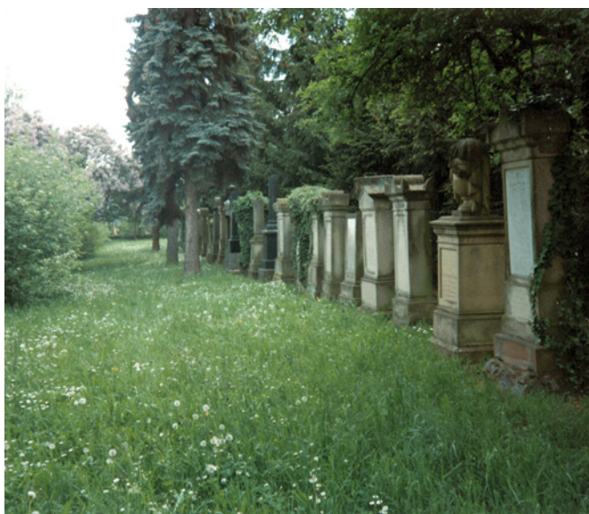
Jüdischer Friedhof Hechtsheim

Weitere Informationen auf www.mainz.de/magenza