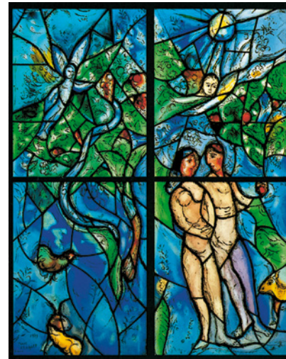
Detail des Mittelfensters