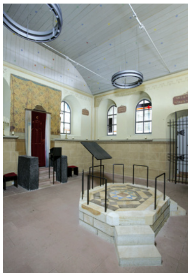
Restaurierte Synagoge Weisenau