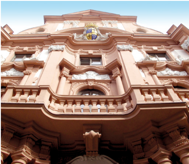
Dalberger Hof (1715 – 1718)

1945 wurde der Dalberger Hof so stark durch Luftangriffe beschädigt, dass der Gefängnisbetrieb eingestellt werden musste. Man verlegte die Gefangenen in Lager in der Umgebung von Mainz. Eine Gedenktafel im Keller des Dalberger Hofes erinnert heute an die Funktion des Gebäudes in der Zeit des NS-Regimes.