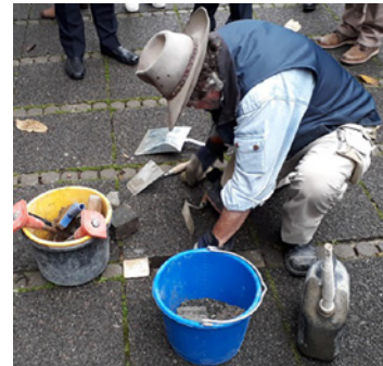
Gunter Demnig beim Verlegen der Steine

Gunter Demnigs Anliegen ist es, mit den Stolpersteinen die Menschen auf der Straße gedanklich zum „Stolpern“ zu bringen. Das individuelle Schicksal der NS-Opfer soll im Alltag präsent bleiben – nicht nur beim Besuch einer Gedenkstätte. Wer sich bückt, um den Text auf den Steinen lesen zu können, verbeugt sich auch symbolisch vor den Opfern.