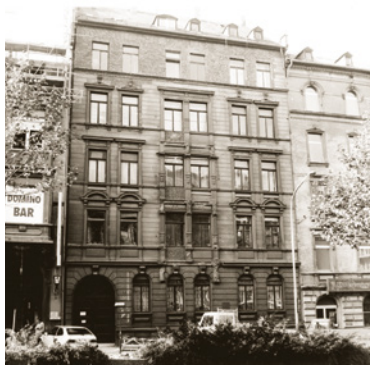
Geburtshaus von Netty Reiling alias Anna Seghers